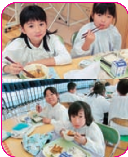
給食委員会(5年・6年)による活動です