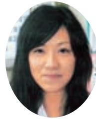
土浦市立神立小学校 (土浦市第二学校給食センター)

これからも子どもたちに喜んでもらえる給食づくりと子どもたちに食の大切さを伝えられるよう頑張りたいです。