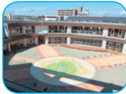
門(杉の子ゲート)をくぐると円形の中庭です。太陽光熱を有効活用しています