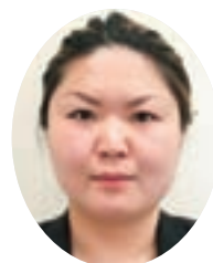
茨城県立鹿島養護学校

最近では、みんながどんな様子で給食を食べているのかを知りたくて、教室にお邪魔するのが楽しみでもあります。全身で「おいしい」を伝えてくれる子どもたちのためにも、献立・食育共に努力していきたいと思っています。