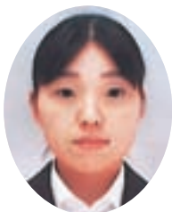
桜川市立雨引小学校 (桜川市南学校給食センター)

そして、これからもおいしい給食を子ども達や先生方に届けられるよう、笑顔がたくさん見られますように頑張っていきたいと思っています。