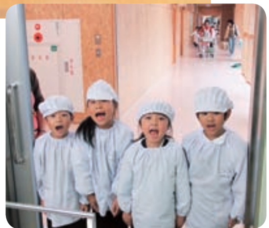
1年生 元気に「ごちそうさまでした」 (水戸市立常磐小学校)