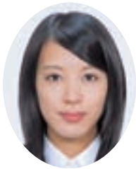
筑西市立大村小学校 (明野学校給食センター)

楽しみにしてもらえる給食や、健やかな成長につながる食の指導に努めていきたいと思っています。