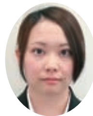
茨城県立土浦養護学校

これからも安心安全でおいしい給食を子どもたちに提供し、子どもたちの生きる力を育てていけるよう努力していきたいと思っています。