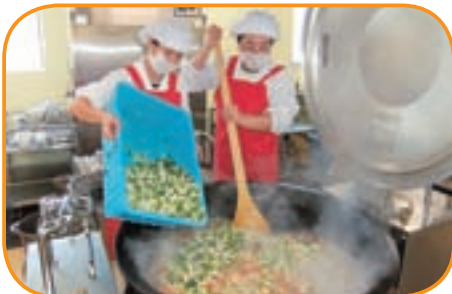
大きな回転釜でけんちん汁を作ります