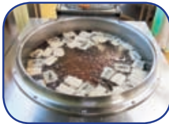
さんまを揚げて南蛮づけにします