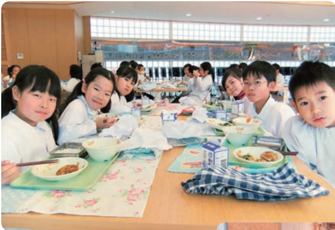
2年生 多目的ホールで会食