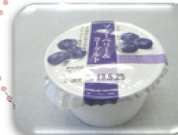
ブルーベリー&ヨーグルト