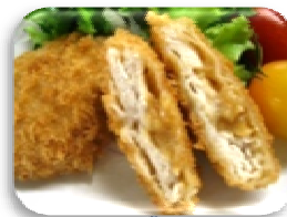
いわしボール 丸和油脂