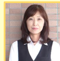
深谷 [ガーデニング]