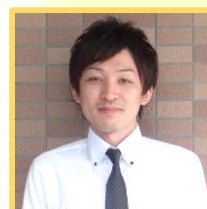
赤羽根 (冷凍) [フットサル]