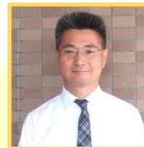
中庭 (課長代理) [読書・大洗散策]