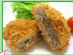
↑茨城県産ごぼうメンチかつ 50g・60g (高久)

茨城県産ごぼうメンチかつ ・ごぼうの臭みがなく、ごぼうが苦手な子どもでも食べやすいと思う。