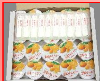
↑カッペリー(温州みかん) 65g (大島食品)