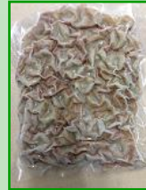
↑いわし入ちくわすライ 500g (ス*ヒロシーフズ)