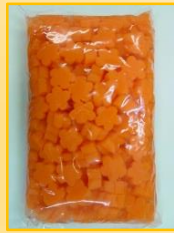
↑梅型こんにやく橙 1kg (東亜商事)