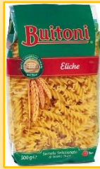
↑ブイトーNo.116エリケ 500g (東亜商事)