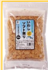
いわしソフト削り 50g (フタバ)