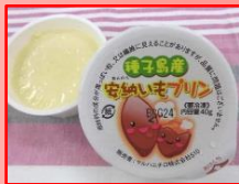
↑種子島産安納いもプリン 40g (マルハニチロ)