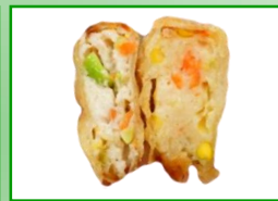
↑野菜豆腐ガレット 20g (かぜ食品)