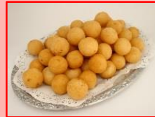
↑ピュッフェ・ミニもちっ 20g (オランダフーズ)