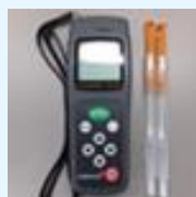
ATP ふき取り検査セット